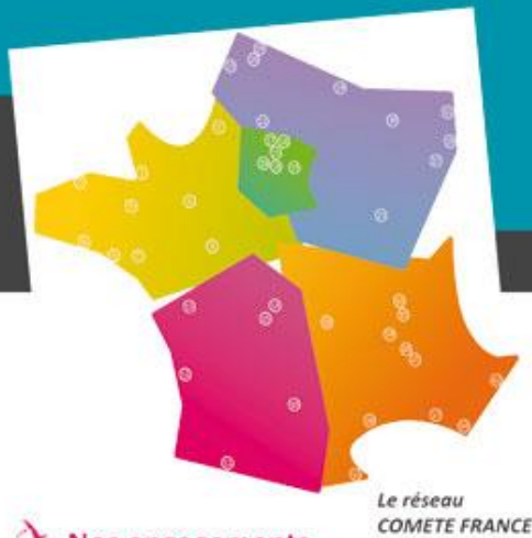
Le réseau COMETE FRANCE

- Promouvoir le réseau des compétences pluridisciplinaires susceptibles de favoriser le retour à la vie sociale et professionnelle.